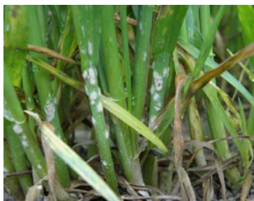
Făinarea Erysiphe graminis