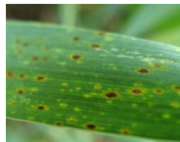
Pătarea reticulară Pyrenophora tritici-repens