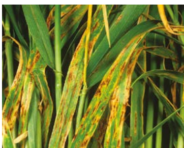
Sfâșierea frunzelor Pyrenophora teres