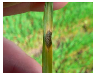
Arsura frunzelor de orz Rhynchosporium secalis