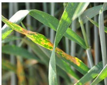
Septorioza frunzelor Septoria tritici