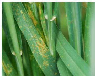
Rugina brună Puccinia recondita