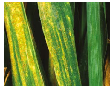
Rugina galbenă Puccinia striiformis