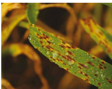
Ramularioza Ramularia collo-cygni